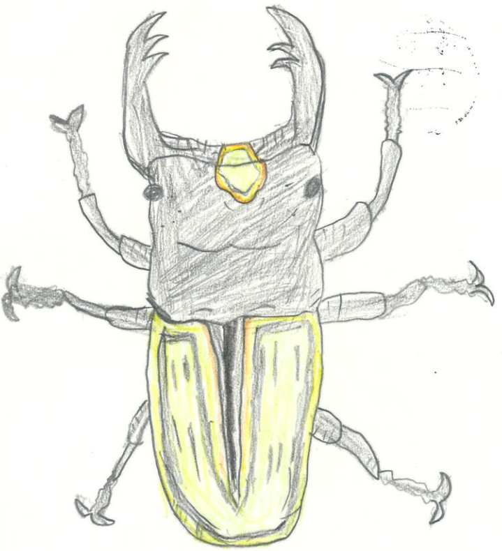
ほかの好きなクワカク です。

私のしょうらいのゆめは、トリマーになることです。 動物のカミをかわいくして、かいぬしさん いようこんでもらいたいです。 動物がこわがっていたら、 おしん + せてが わいくしたいです。